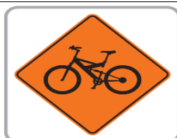
CICLISTA EN AL VÍA