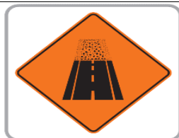
FINAL DEL PAVIMENTO