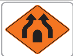
FINAL DE VÍA CON SEPARADOR UN SENTIDO