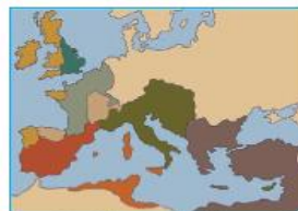
Antiguos dominios del Imperio romano al finalizar las invasiones bárbaras.

4. Observa con atención el mapa. Luego, responde las preguntas en tu cuaderno.