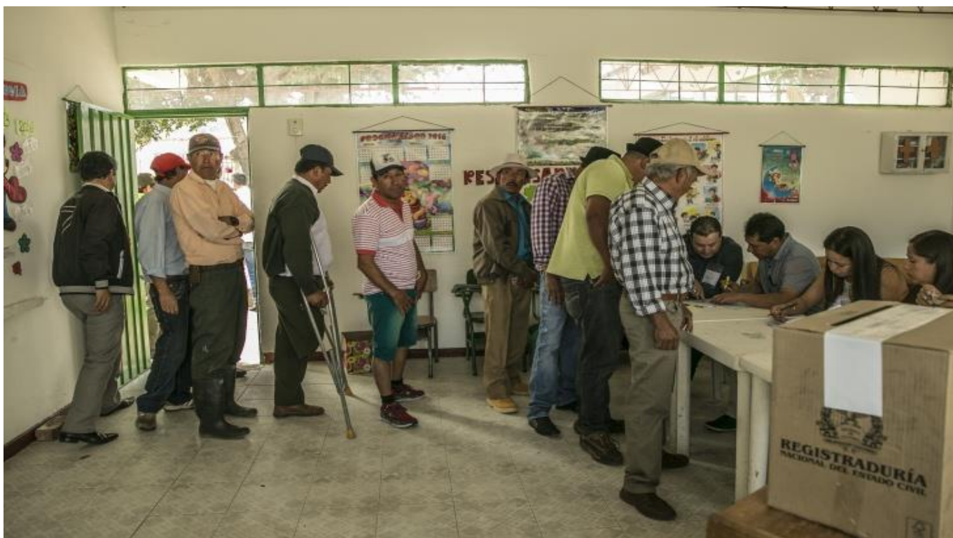
IMAGEN DE PERSONAS VOTANDO (PARA EXPLORACION DE SABERES PREVIOS)