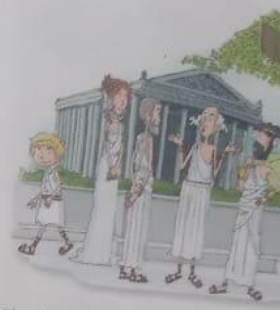
El origen de la democracia se remonta al siglo V antes de Cristo en una ciudad griega llamada Atenas.

Es la facultad que tiene el pueblo para despojar de su cargo a quien ha elegido, cuando esta persona no cumple los compromisos hechos al momento de su elección.