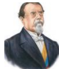
José Manuel Marroquín Manuel Murillo Toro Tomás Cipriano de Mosquera Rafael Núñez