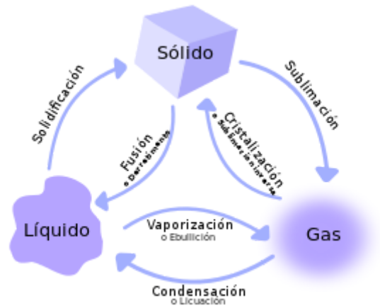
Diagrama de los cambios de estado entre los estados sólido, líquido y gaseoso.